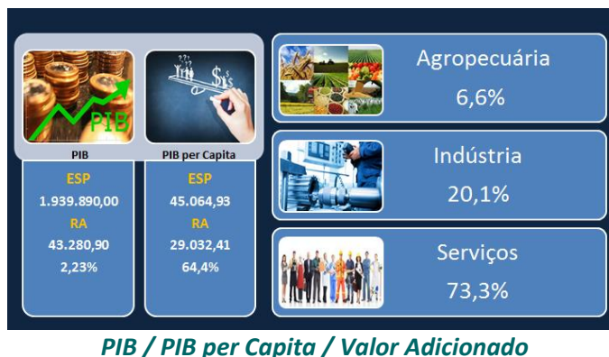
PIB / PIB per Capita / Valor Adicionado

Na atividade industrial, destacam-se as agroindústrias da laranja, com grandes unidades processadoras de citros e de cana-de-açúcar. Além disso, são importantes as indústrias de borracha, moveleira e curtumes. E, aproveitando as matérias-primas regionais, ainda se sobressaem as indústrias do fio da seda e de joias.